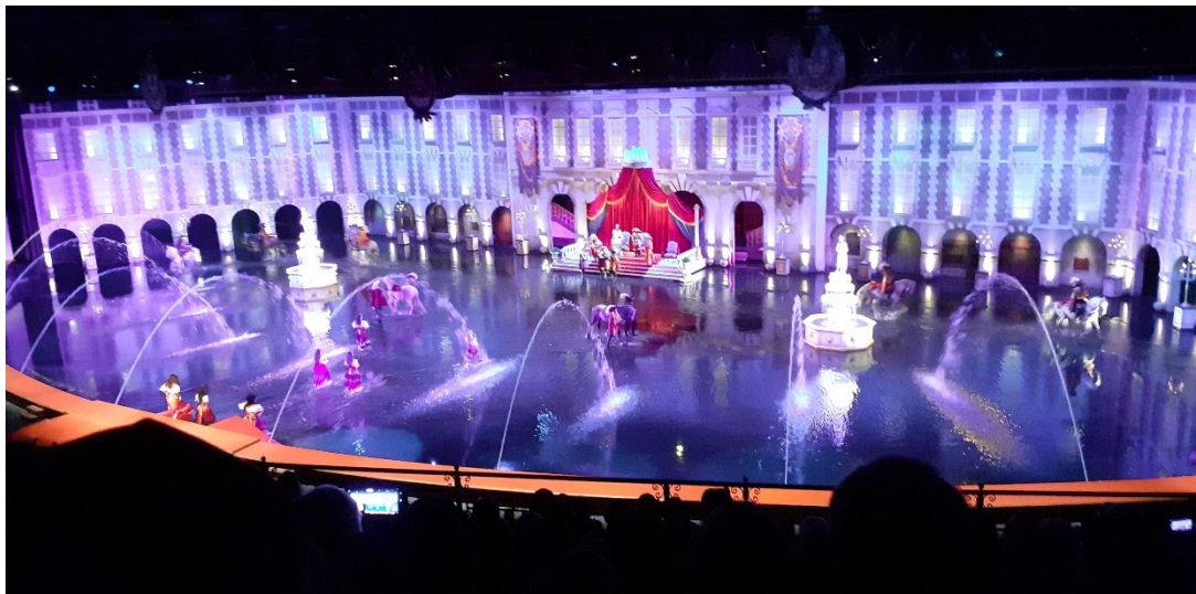
Un exemple de spectacle couvert : chevaux et personnages sur une scène animée

Ce ne sont que quelques exemples des nombreux attrait et attractions offerts par le parc du Puy du Fou.